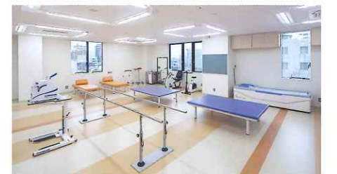
リハビリテーション室